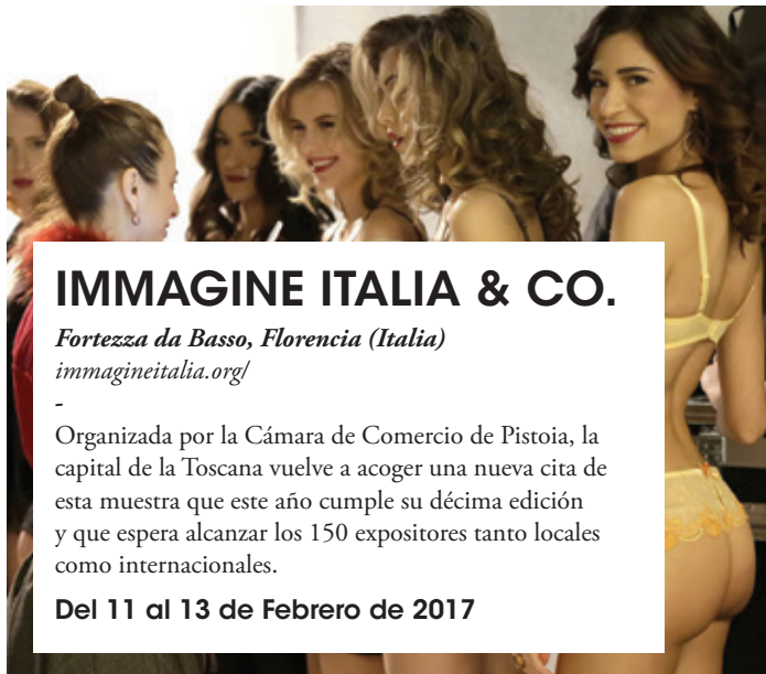
IMMAGINE ITALIA & CO.

Fortezza da Basso, Florencia (Italia) immagineitalia.org/